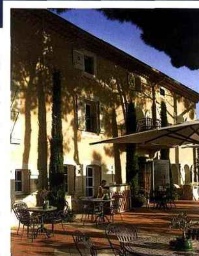
Un authentique mas du XVIII e siècle qui allie charme, confort, service et prestations contemporaines haut de gamme.